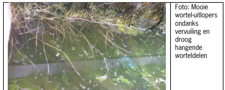
Foto: Mooie wortel-uitlopers ondanks vervuiling en droog hangende worteldelen

Er zijn geen symptomen van Fusarium tot nu toe gevonden.