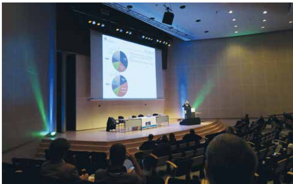
Één van de vele lezingen bij de EAS conferentie in de grote congreszaal.

De Aquaculture Europe conferentie 2015 richt zich op de rol en de bijdrage van aquacultuur aan het beheer van de natuurlijke hulpbronnen en het belang ervan in de samenleving, door het produceren van voedsel van hoge kwaliteit, dat voedzaam en gezond is.