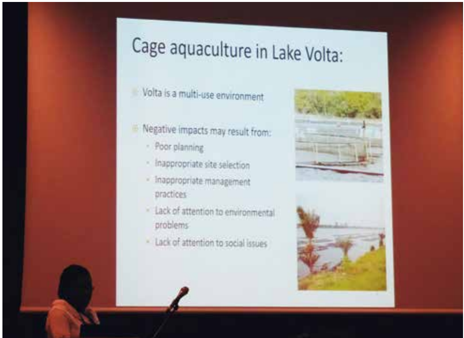
Selectie van kooicultuurgebieden in het Ghanese Volta meer.

Woensdag is de eerste dag, ik ben wat laat en mis de plichtplegingen van de opening, maar de beursvloer is nog rustig en bij het standje van de Dutch Aquaculture Experts is er alle tijd om onder de koffie wat bij te praten en te netwerken. De dag begint met een half dagdeel over biologische visteelt en daar wil ik bij zijn. Bij de ingang van de zaal wordt ik er echter uitgepikt: mijn kaartje heeft een bruin randje: dat betekent beursbezoeker en dan mag je niet naar het congres. Naar beneden gehold en met een blauw randje op de kaart en 275 euro lichter weer snel de trap op naar de zaal. De verhalen zijn interessant, goed te volgen en geven de burger moed: er is niet al te veel veranderd in de paar jaar dat ik biologische visteelt even links heb laten liggen. Tijdens de lunch word ik door Stefan Bergleiter van Naturland helemaal bijgepraat over de laatste stand van zaken in de wereld van de