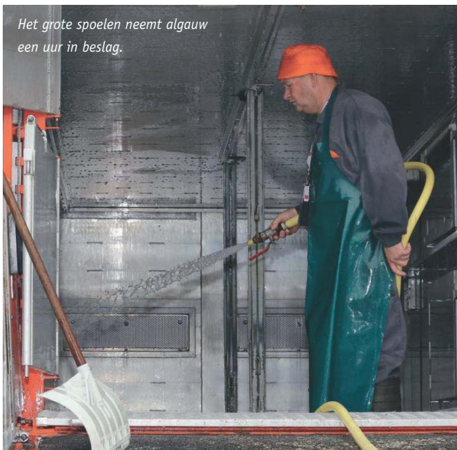
Het grote spoelen neemt al gauw een uur in beslag.