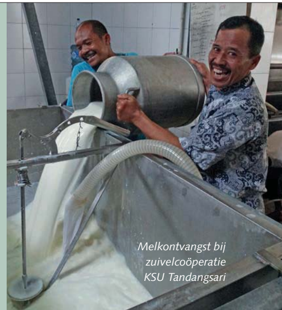
Melkontvangst bij zuivelcoöperatie KSU Tandangsari

of nauwelijks kunnen rondkomen: 'De meeste boeren klussen er overdag nog bij. Ze zouden de melkveetak tot een corebusiness moeten ontwikkelen.' Dierenarts Koko werkt voor de coöperatie. Hij legt uit dat hoogproductieve koeien op Java hooguit twee lactaties meegaan. 'Het probleem is dat deze koeien geen toereikende verzorging krijgen. Boeren zijn niet in staat deze koeien te voorzien in hun behoeften.' Volgens Koko is een productie van 15 tot 20 liter wel haalbaar, maar dan zullen de boeren hun bedrijf fors moeten upgraden.