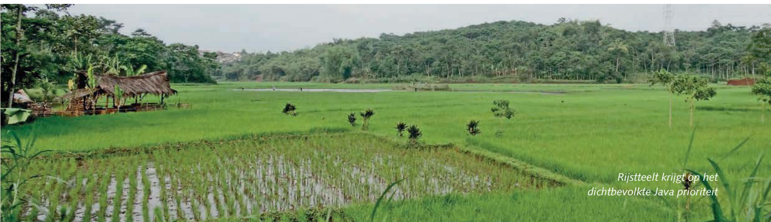
Rijstteelt krijgt op het dichtbevolkte Java prioriteit

Als de melk arriveert bij de fabriek, is het kiemgetal doorgaans hoger dan 300, aanzien een snelle koeling achterwege blijft. Het celgetal ligt gemiddeld op 800.000 cellen per milliliter. Een gebrek aan hygiëne in de ligplaatsen van de koeien is een belangrijke oorzaak. Indonesische koeien staan in het vochtige klimaat het jaar rond (aangebonden) op stal. Vooral omdat weiland niet beschik-