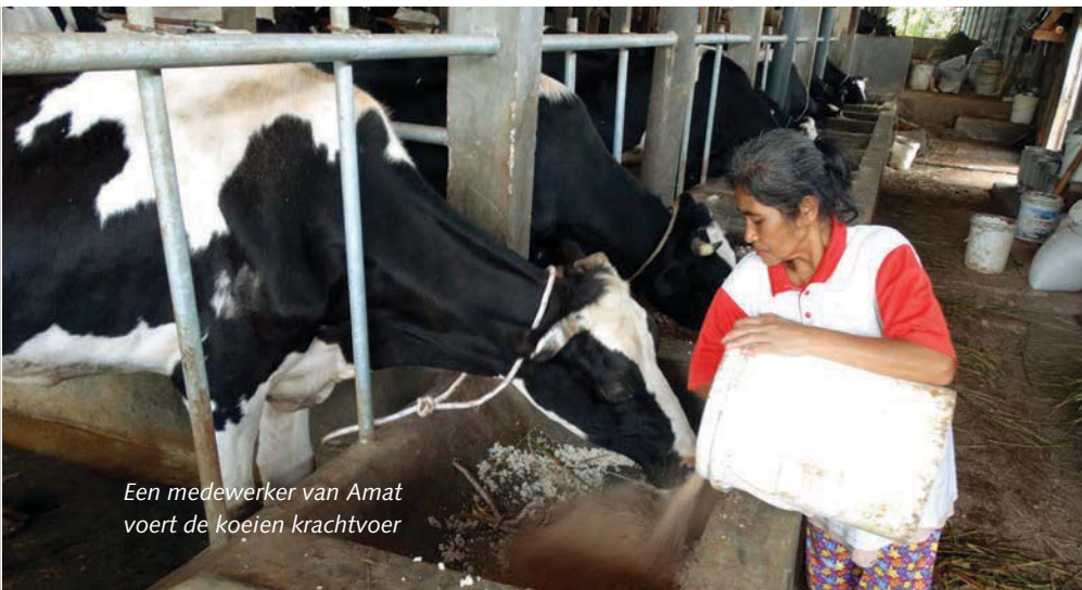
Een medewerker van Amat voert de koeien krachtvoer