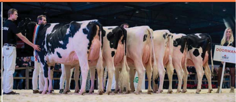
Doorman toonde een groep met ondiepe uiers

Net als McCutchen kreeg ook Chevrolet , eigen aan ki-organisatie CRV, kansen als stiervader. Het zestal van Chevrolet (v. Freddie) bevatte lenige, soepel bewegende melkkoeien, die gezien de passende conditie duidelijk geen moeite hadden met de hoge melkplasvererving (+1454 kg). Het beenwerk werd vlot gebruikt, bezat voldoende hak en was correct van stand. De vooruiers waren voldoende vast aangehecht, terwijl de hoogte en breedte in de achteruiers varieerde. Ook hier gold dat de groep het niveau in diepte van de laatste rib en openheid van het frame niet van voor tot achter kon vasthouden, wellicht mede doordat de selectieruimte met ruim 180 melkgevendende dochters beperkt was.