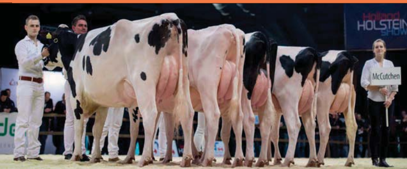
In de groep van McCutchen liepen grote dochters met diepe borst