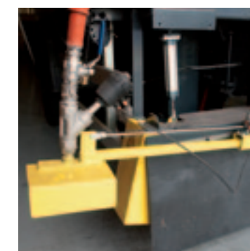
MixFill+ kan de pekelsproeiers voorzien van een kleine spuitarm.