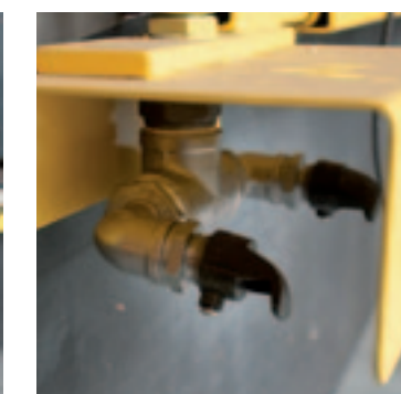
De spuitarm van de MixFill+ heeft twee spuitdoppen. Hiermee kun je plaatsspecifiek pekelsproeiers spuiten.