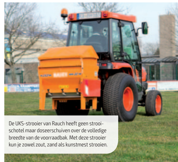
De UKS-strooier van Rauch heeft geen strooi-schotel maar doseerschouwen over de volledige breedte van de voorraadbak. Met deze strooier kun je zowel zout, zand als kunstmest strooien.

Als het zout wegspoelt, belandt het wel in het riool en zo in het oppervlaktewater,