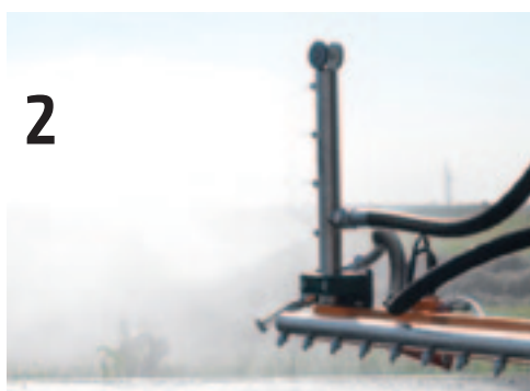
Een verticale spuitboom aan de uiteinden van de spuitboom maakt het mogelijk om bijvoorbeeld vangrails schoon te spuiten.