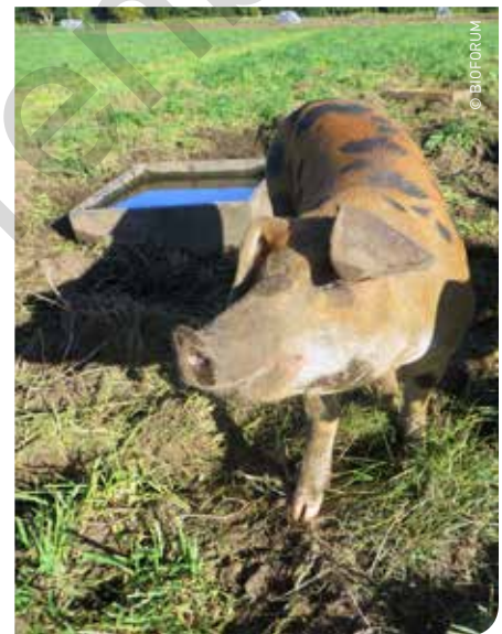
Door de toegenomen vraag van onder andere Duitse discounters is er al zo'n drie jaar een tekort aan biologisch varkensvlees op de Europese markt.

varkens. In België worden slechts een 10.000-tal biologische vleesvarkens gehouden, voornamelijk in Wallonië. Door een toegenomen vraag van onder andere Duitse discounters, is er al zo'n drie jaar een tekort op de Europese markt. De prijzen namen in 2016 toe tot 3,74 euro/kg (slachtgewicht afgeleverd aan het slachthuis, exclusief btw) voor klasse E-varkens in Duitsland en tot 4,31 euro/kg bij Friland in Denemarken. Bij deze hoge prijzen moet wel gewezen worden op de hoge kostprijs van de biologische varkensproductie, onder andere door de duurdere biologische veevoerders en een hogere voederconversie. Het Belgische Lovenfosse/Westvlees gaf onlangs te kennen op zoek te zijn naar een bijkomende productie van 50 à 70