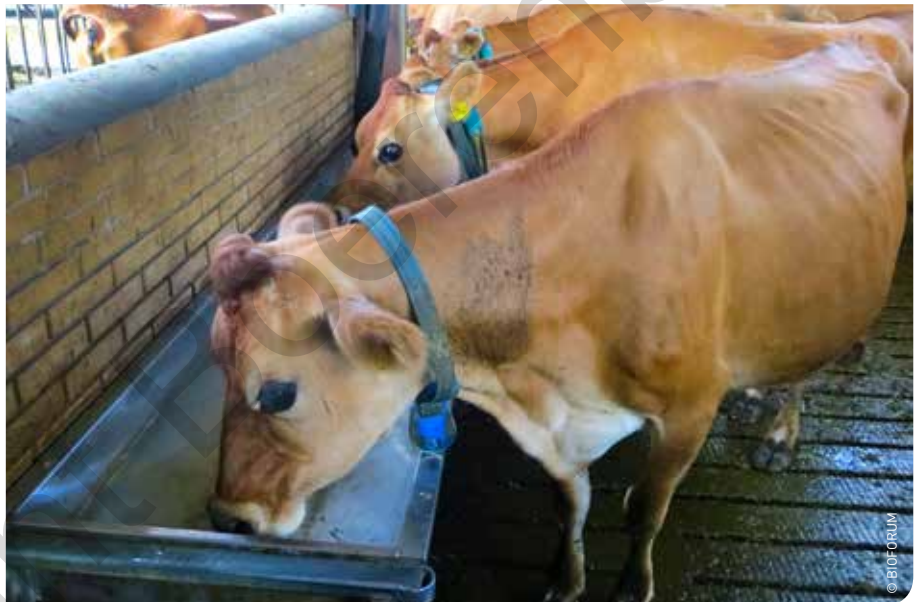
Door de grote vraag naar biomelk schakelen sinds het voorjaar steeds meer Europese melkveehouders om naar de biologische productie.

voor biologische melk bij diverse Europese melkophalers al langere tijd tussen 47 en 50 euro/100 kg (4,2% vet, 3,4% eiwit). Die prijzen staan in schril contrast