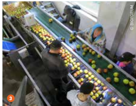
1 Diepvriesgroenteverwerkers Ardo en Pinguin gaven vorig jaar al aan mogelijkheden te zien in de biomarkt. 2 Er is al meerdere jaren een chronisch tekort aan biologisch pitfruit voor industriële verwerking. 3 Toch wordt bij ons in deze sector nauwelijks omschakeld naar bio.

voorbij jaren, vooral wegens de moeilijke weersomstandigheden (vorst in Oostenrijk). Ook de kwaliteit is dit jaar duidelijk minder goed.