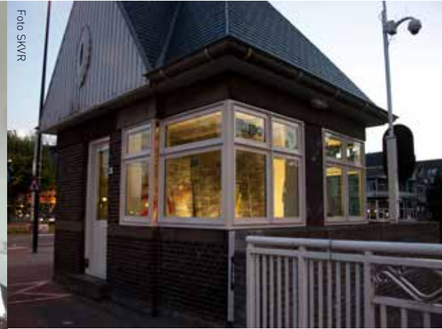
Het brugwachtershuisje op de Lage Erfbrug over de Schie in Delfshaven. Het huisje doet dienst als expositieruimte voor amateurkunstenaars uit de buurt, voor Rotterdamse fotografen en als minipodium voor muzikoptredens