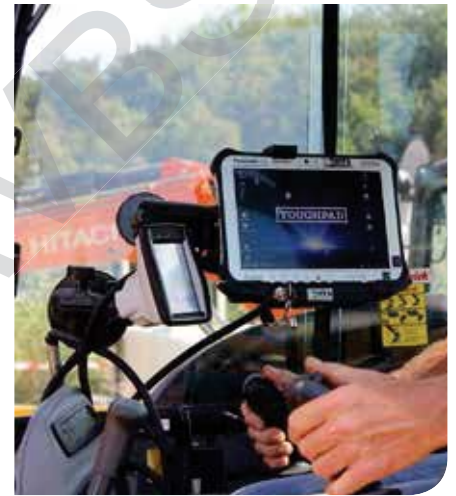
De bezoeker kon op het grote demonstratieterrein de mogelijkheden van alle mogelijke graaf- en tuinmachines ontdekken.