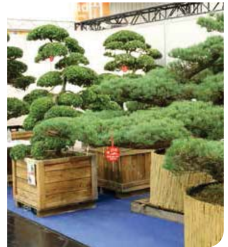
Op GaLaBau kon je groene inspiraties opdoen en alles vinden van een scala aan speeltuigen en alternatieve trampolines, designmeubelen tot alternatieve verhardingen en tuinmaterialen.

nieuwe generatie graafmachines werd overduidelijk als de nieuwe rechterhand van de tuinaannemer voorgesteld. Een gamma van toebehoren zoals diverse graaf- en laadbakken, trilplaten, hefvoeren, reinigingstrommels, veegborstels,... kunnen zonder dat de chauffeur de cabine moet verlaten razendsnel gewisseld worden aan de hand van diverse auto-