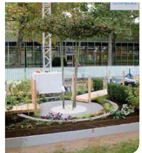
In het randprogramma dat werd georganiseerd door het 'Bundesverband Garten-, Landschafts- und Sportplatzbau' is de 'Landschaftsgärtner-Cup' een vast onderdeel.