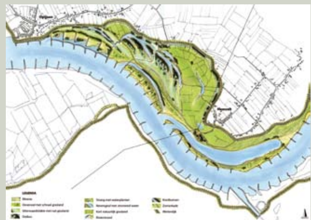
Plan Heesseltsche Uiterwaarden na optimalisatie