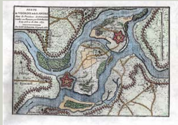
Kaart Heesselt en omgeving 1672

Langs de grote rivieren lopen allerlei initiatieven om Nederland beter voor te bereiden op komende klimaatveranderingen. Ook langs de Waal worden uiterwaarden op grote schaal heringericht. Lastig daarbij is dat het nut en de noodzaak van deze projecten door omwonenden en ondernemers in de uiterwaarden onvoldoende worden gezien.