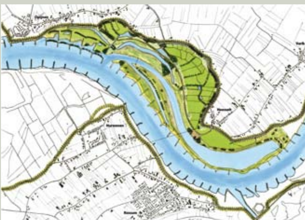
Oorspronkelijke plan Heesseltsche Uiterwaarden

Omdat de planstudie doorloopt tot 2012 is het nog te vroeg om conclusies te trekken. Toch zijn partijen het erover eens dat de werksessies in Heesselt hun meerwaarde hebben bewezen: door te luisteren, vast te leggen en open terug te koppelen is het voor de bewoners duidelijk dat er serieus met hun wensen en zorgen wordt omgegaan. Zij kunnen hun rol als mentale eigenaar van de uiterwaard nu nadrukkelijk nemen. Daarmee is niet gezegd dat er ook breed draagvlak aanwezig is voor de herinrichting van de Heesseltsche Uiterwaarden. Nog steeds zetten veel omwonenden hun vraagtekens bij het nut en de noodzaak van het project, maar ook zij zullen niet ontkennen dat het nodige in de plannen is verbeterd. De komende maanden gaan Rijkswaterstaat en consortium aan de slag met een advies aan de Staatssecretaris van Verkeer en Waterstaat voor het kiezen van een voorkeursalternatief. Daarna zal het consortium dat alternatief verder uitwerken in een inrichtingsplan en een bestemmingsplan. Daarvoor wordt ook een m.e.r.-procedure doorlopen. Dan zal blijken of ook alle zorgen bij omwonenden en ondernemers zijn weggenomen.