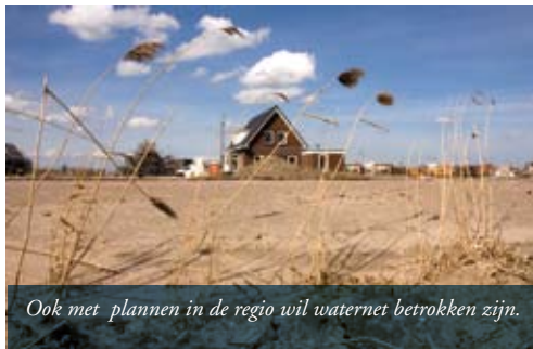
Ook met plannen in de regio wil waternet betrokken zijn.

Waternet zet in op klimaat neutraal en duurzaam ondernemen. Door het terugdringen van de uitstoot van broeikasgassen, gebruik van minder en duurzame energie, water als brandstof, zorgvuldig omgaan met grondstoffen, duurzame bouw van waterinfrastructuur en aandacht voor ecologische thema's geeft Waternet hieraan vorm. Kruize: "De samenwerking met energie bedrijven is hier een stimulerend initiatief in en bij duurzaam ondernemen hoort ook de hulp en samenwerking die Waternet geeft aan 'water operated partnership'." Onder meer middels projecten in Suriname, Egypte en Zuid-Afrika. "Door de krachten te bundelen kunnen we ook waterprojecten in ontwikkelingslanden ondersteunen en opzetten."