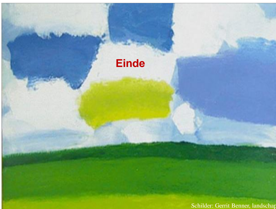
Schilder: Gerrit Benner, landschap