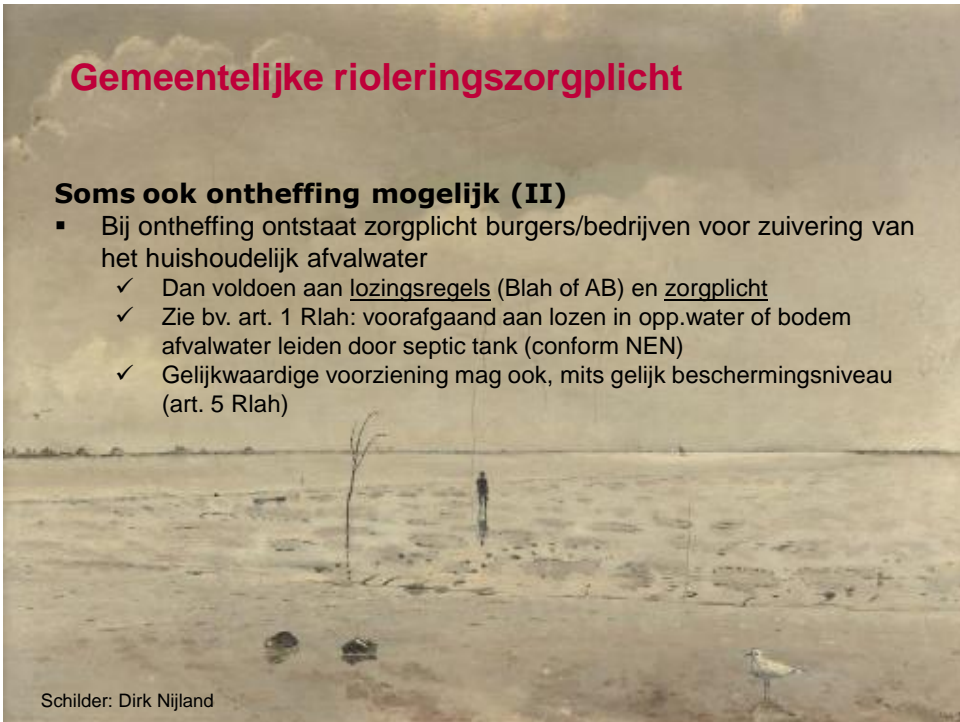
Schilder: Dirk Nijland