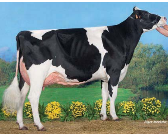
Amaru (v. Atwood), kampioene vaarzen Prod.: 2.04 186 6491 4,17 3,20 lw 113 l.l.