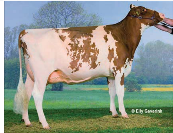
Dol's Odeline 2 (v. Big Apple ), kampioene vaarzen rood Vsp. prod.: 2.01 305 7516 6,06 3,67 lw 123