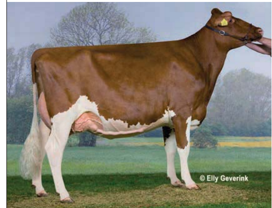
Bossink Jacoba 19 (v. Pleasure ), kampioene oud rood Prod.: 1.11 324 9909 4,00 3,44 lw 115