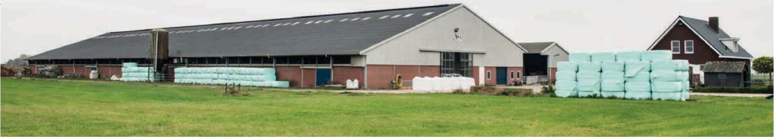
De gebouwen zijn in goede staat