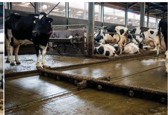
De mestschuif houdt de roosters schoon

In 2014 startte de zoektocht naar een nieuw bedrijf met ruimte voor ongeveer 150 koeien en voldoende grond. Nadat