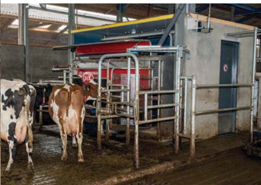
De koeien worden in twee groepen gemolken

De familie Verschure kwam uiteindelijk in Binde, in de deelstaat Saksen-Anhalt, terecht: op de grens van Oost- en West-Duitsland. 'Een typische Oostblokboerderij. Zeer goed opgezet, prima gebouwen met ruimte voor 350 koeien en 450 hectare goede grond: de randvoorwaarden waren perfect', laat Richard weten. 'Maar binnen een week zei ik tegen Monique dat we hier niet oud zouden worden.'