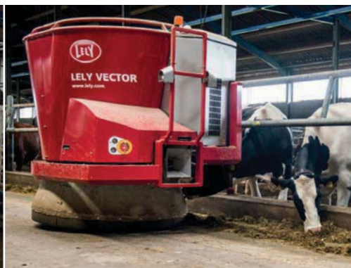
Vier à vijf keer per dag een verse portie voer