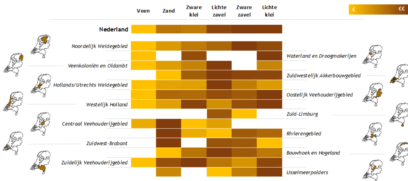
Figuur 1 Agrarische grondprijverschillen naar grondsoort en landbouwgebied a)

Het landelijke patroon van een oplopende grondprijs in de reeks veen - zand/zware klei - zavel/lichte klei, geldt in het algemeen ook voor de groepen van landbouwgebieden (figuur 1). In enkele gebieden wijkt het beeld echter wel af van het landelijke. Dat geldt vooral voor de zandgronden die in het Centraal en Zuidelijke Veehouderijgebied, het Rivierengebied en Zuidwest-Brabant (bijna) de hoogste grondprijzen noteren.