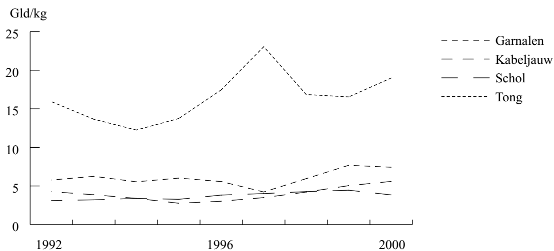
Figuur 1.1 Aanvoerprijzen op de Nederlandse afslagen

Voor tong en kabeljauw werd op de afslag een respectievelijk 15 en 11% hogere prijs betaald. Daarentegen daalde de scholprijs met 14% ten opzichte van 1999. In bijlage 4 staat een gedetailleerd overzicht van de aanvoerprijzen. Het aanvoervolume van garnalen en kabeljauw was ongeveer 20% lager.