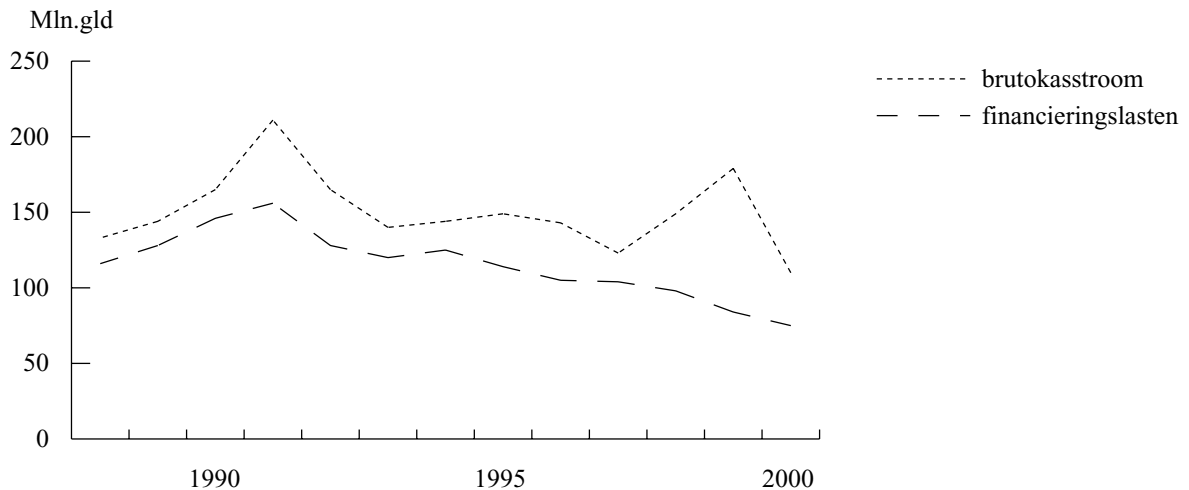
Figuur 3.1 Brutokasstroom en financieringslasten voor de sector als geheel

Voor een gemiddeld kottersbedrijf kwam de nettokasstroom uit exploitatie, na betaling van aflossing en rente, uit op naar schatting 109.000 gulden positief. Dit is een forse achteruitgang in vergelijking met 1999 (300.000 gulden).