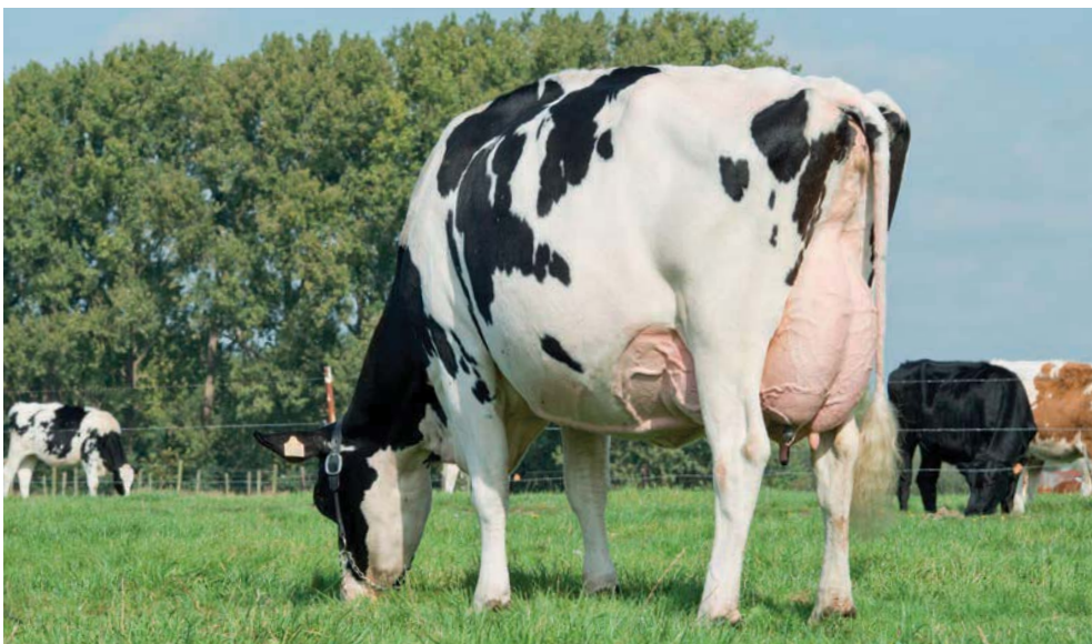
Savardochter Louise enige Vlaamse zwartbonte met 92 punten