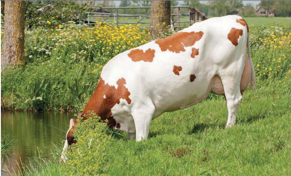
De Vinkenhof Danielle 95 (v. Baltimore) kreeg 91 punten