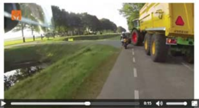
De trekker in bovenstaand filmpje wil linksaf slaan. Toch passeert de motor hem nog. Welke fout of fouten worden er gemaakt?

Het tweede onderdeel in de E-learning gaat over de bestuurder. Welke situaties komt de bestuurder tegen en hoe gaat hij daar mee om? Onderstaande foto is uit het filmpje 'Wat doe jij in deze situatie?' Een filmpje dat toevallig met een GoPro is opgenomen door een motorrijder. Hoe loopt dit af?