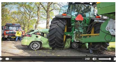
Bekijk bovenstaand filmpje. Met (land)bouwuvoertuigen gebeuren relatief meer ernstige ongelukken op de weg. Wat zijn hiervan de oorzaken? (Meerdere antwoorden mogelijk)

Het is toch fantastisch om elke dag te mogen rijden met grote (land)bouwmachines met grote banden. Wie wil dat nou niet? Maar hoe doen we dat nu zo veilig mogelijk? Hoe zorgen we ervoor dat het voertuig zo veilig mogelijk is? Het onderdeel 'Veiliger voertuig' in de E-learning gaat over markering, bumpers, remmen en belading.