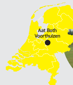
Aat Both Voorthuizen

SpeedMatch-functie. "Het is prettig om de rijsnelheid vast te zetten." Tijdens het werk maakt de machine veel toeren, waardoor hij wel de nodige brandstof verbruikt. Both: "Het verbruik is redelijk. Wel vind ik de brandstoftank aan de kleine kant." Naast het gras rapen gebruikt Both de trekker ook voor strooien en spuiten. In de toekomst wil Both de trekker voorzien van een maaialarm zodat hij er ook de heggen mee kan snoeien.