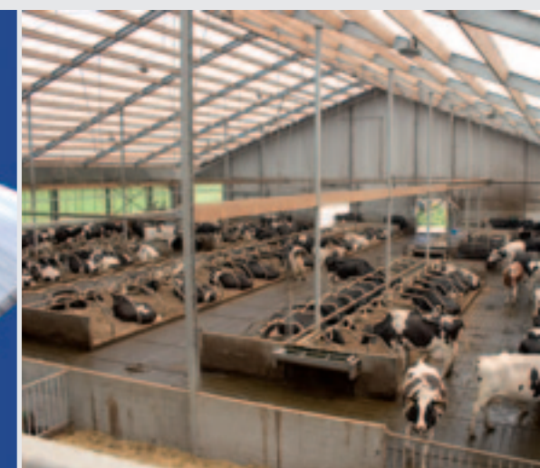
Opvallend in de stallen met een Lightroof-dak is het vele daglicht dat binnendringt. Dit beeld is gemaakt in de stal van Henry Bouwmeester.