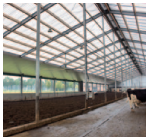
Veel licht in de stal verbetert het composteringsproces van de mest in de vrijloopstal van Willy en Harry Grevers.