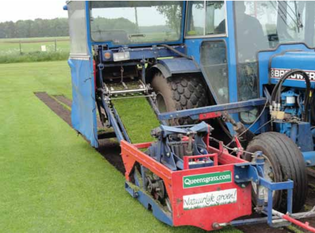
Oogsten van de mat.

deld een jaar. Twee weken vertraging vind je in de productieplanning nauwelijks tot niet terug. Ik wacht daarom liever twee weken op de juiste groeiomstandigheden dan dat ik met bovenmatige straatgrasdruk te maken krijg.'