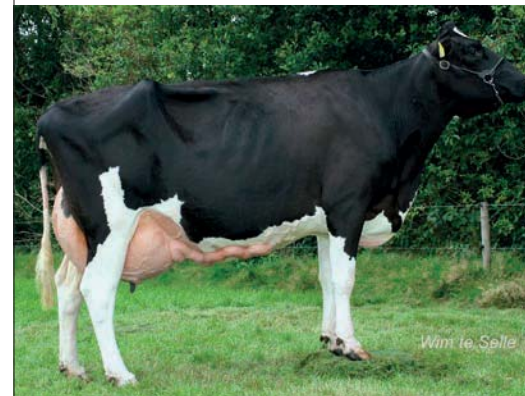
Rieten Sijke 512 (v. Mr Sam), alg. kamp. Prod.: 3.11 314 12.245 3,70 3,14 lw 108