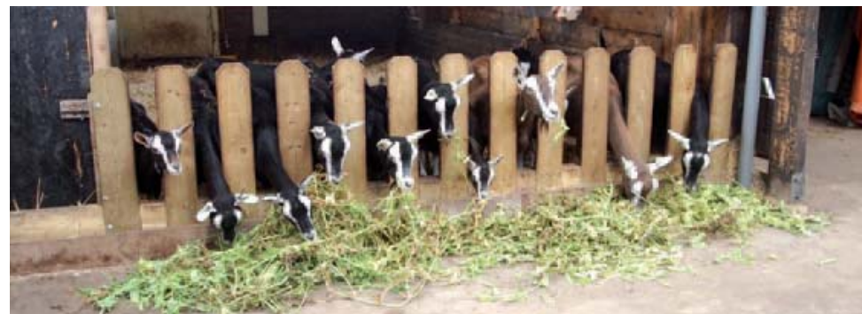
De stal omvat zowel bruine als zwarte Toggenburgers, maar de zwarte krijgen nu toch de overhand.