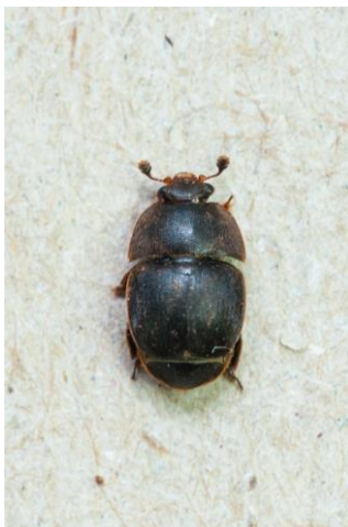
Aethina tumida , Foto: B. Cornelissen