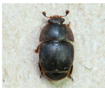
Aethina tumida

L: 5-7mm Kleur: bruin tot bruinzwart Antenna: Knotsvormig stomp