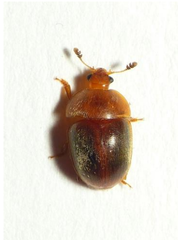
Cychramus luteus