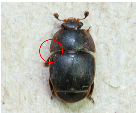
Aethina tumida