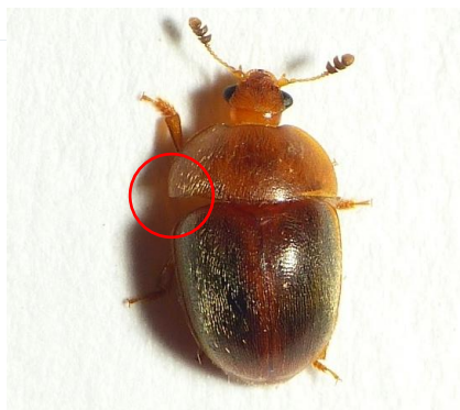
Cychramus luteus