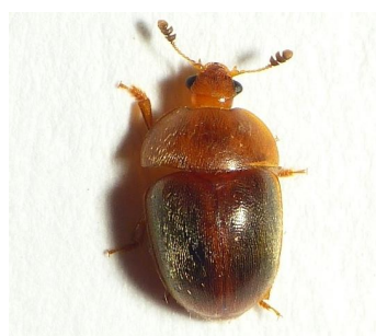
Cychramus luteus

L: 3-5.6mm Kleur: lichtbruin Antenna: knotsvormig, langwerpig