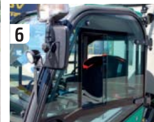
Raamstijlen hinderen het zicht naar opzij nauwelijks.