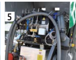
Voor onderhoud kunnen beide zijkanten en de achterkant uitgeklaapt worden. Mocht er iets zijn onder de cabine, dan kan die in haar geheel naar voren gekanteld worden.