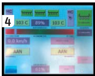
Op het touchscreen kun je alle functies van de Multihog en de Wave in de gaten houden.