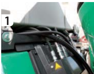
De hydrauliekventielen zijn middels slangen onder de cabine door ook voorop te gebruiken...