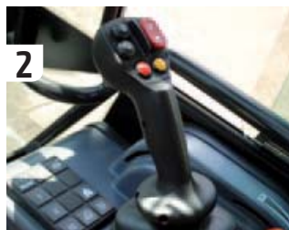
De bediening van de Multihog is niet moeilijk. De joystick oogt niet ingewikkeld en dat is hij ook niet. Als je het instructieboek goed doorneemt en de verschillende versnellingen onder de knie hebt, rijd je er zo mee weg.