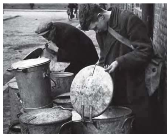
Naast het plaatje van Varkens in Nood kun je een ander beeld laten zien: de Hongerwinter van 1944.