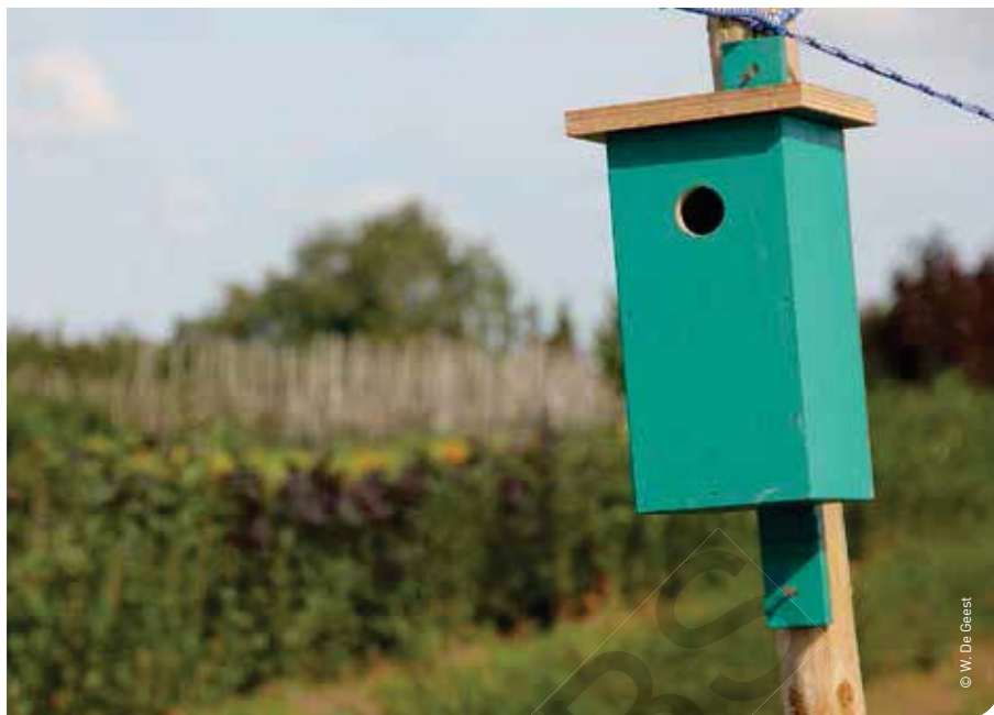
▲ In de praktijkgids Natuur komen o.a. tips aan bod om belangrijke bondgenoten op uw bedrijf meer kansen te geven.

planten. Hoe kunt u dit bodemleven stimuleren?