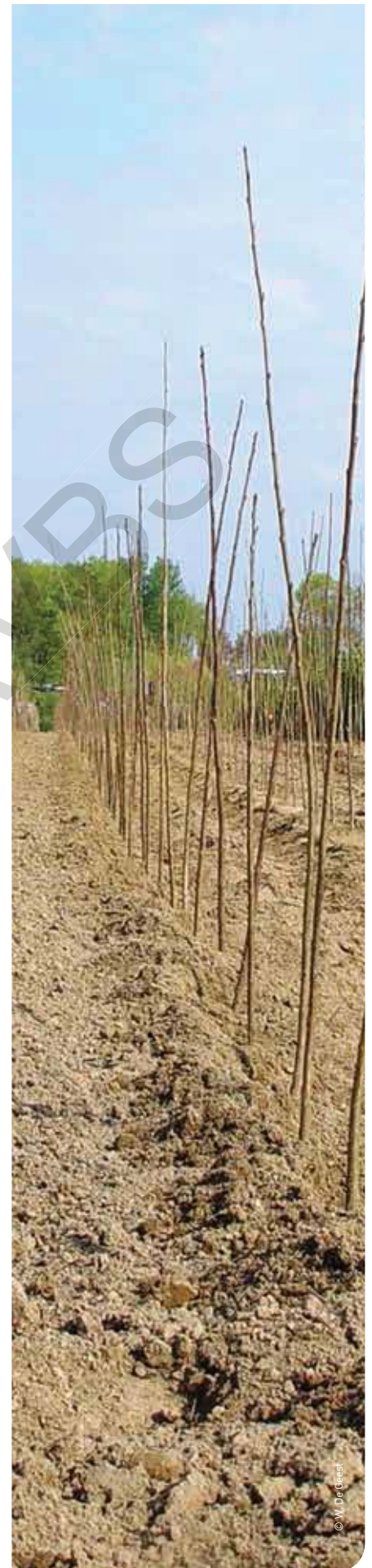
▲ Boomkwekerij heeft code MT: meerjarige teelt.