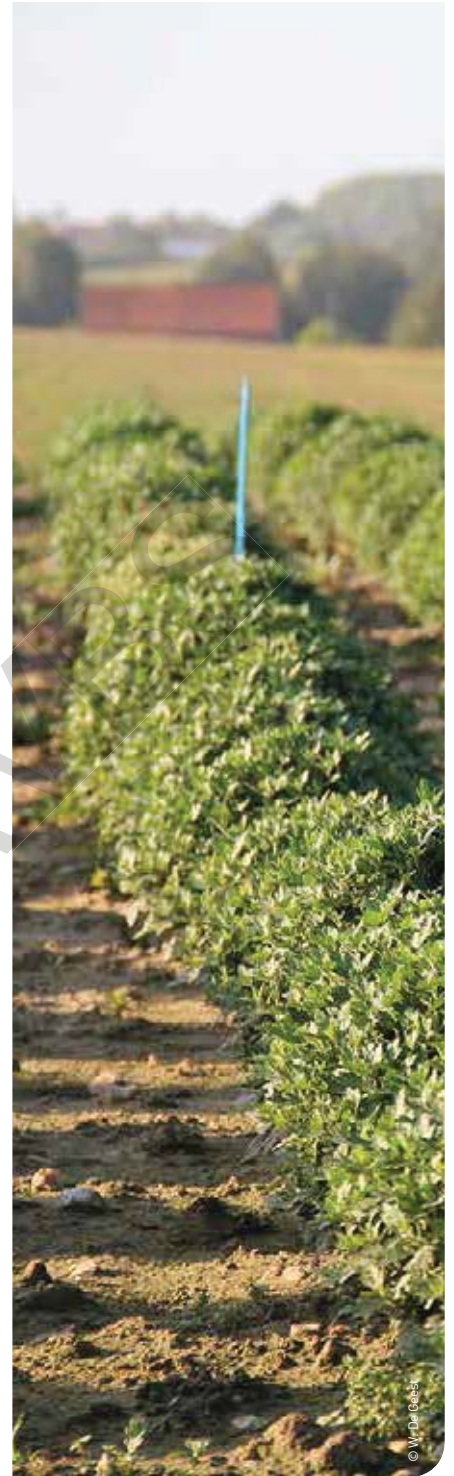
▲ Knolbegonia en potchryasant hebben code ZT: teelten die na 1 januari op het veld komen.