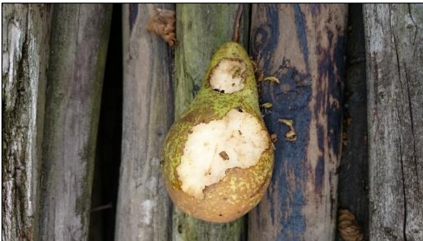
Figuur 2. Foto van aangevreten Conference peer op locatie 2 in week 1. Schade waarschijnlijk veroorzaakt door muizen en/of vogels. Peer hebben in week 2 een nieuwe plek gekregen waarmee het probleem opgelost was.

Figuur 2 van bijlage 2. Foto van schade aan peer op locatie 2 in week 1. Schade is veroorzaakt door muizen en/of vogels. In week 2 zijn de bakjes verplaatst naar een nieuwe plek waarmee het probleem verholpen was.