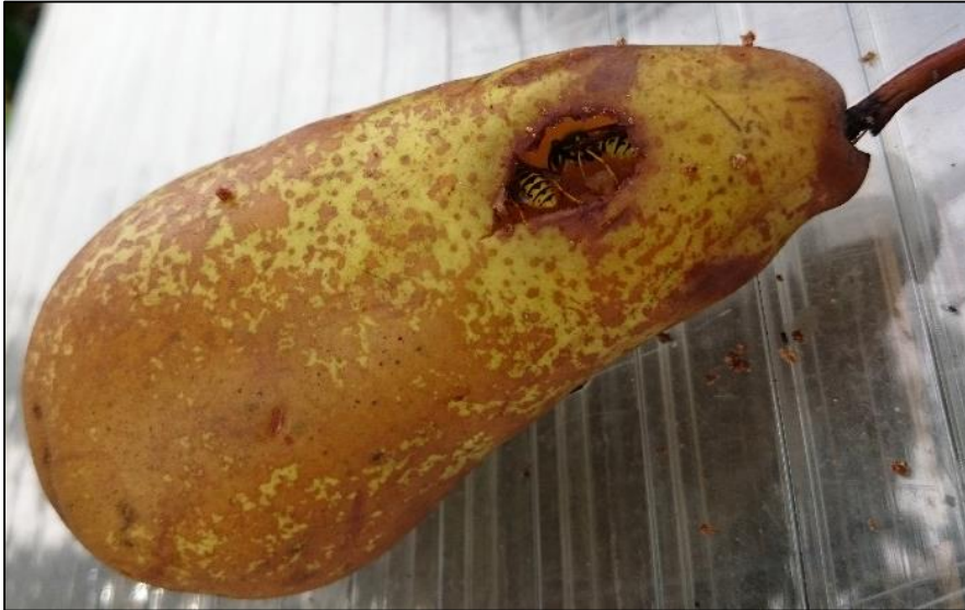
Figuur 1. Foto van aangevreten Conference peer (klasse +/-) met twee wespen erin. De wespen zijn van de soort Vespula germanica .

Figuur 1 van bijlage 2. Foto van twee wespen ( Vespula germanica ) in een aangevreten Conference peer op locatie 1. De gebruikte Conference peer was van klasse +/- . Vooral aan de bovenkant van de peer, rond het steeltje, is te zien dat de peer zachte en beurze plekken heeft.