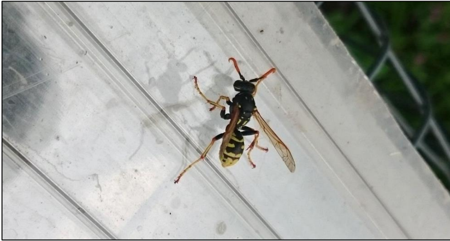
Figuur 3. Foto Franse veldwesp ( Polistes dominulus ) gevonden op locatie 1.

Figuur 3 van bijlage 2. Foto van de Franse veldwesp ( Polistes dominulus ) die bij een peer zat. Deze is in het veld gedetermineerd.