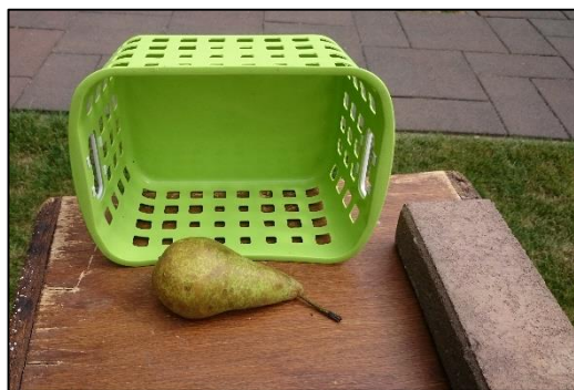
Figuur 2. Benodigdheden voor de proefopstelling. In viervoud uitgevoerd vormt één complete proefopstelling.

Voor de proefopstelling is gebruik gemaakt van kunststof bakjes met gaten erin (figuur 2). De bakjes hebben een afmeting van 22,5 cm x 17 cm x 12,5 cm (lengte x breedte x hoogte). Hier past een Conference peer goed in, zonder dat deze tegen de rand aan ligt en zo binnen het bereik van vogels komt. De afmetingen van de gaten zijn 1,5 cm x 1,5 cm. Het is van belang dat deze gaten groot genoeg zijn voor wespen, maar te klein voor vogels en andere dieren om doorheen te komen.