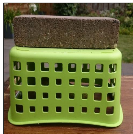
Figuur 3. Proefopstelling compleet met Conference peer onder het bakje.

Om te testen of de proefopstelling de wespen niet afschrikt of voorkomt dat ze zich met de peer voeden, zijn beschadigde peren onder een aantal bakjes geplaatst in week 1 en 2. De Conference peren waren zo een makkelijk bereikbare voedselbron voor de wespen en zouden deze dus aan moeten trekken. In week 1 zijn op elk bedrijf twee bakjes met een licht beschadigde peer (klasse -) en twee bakjes met een gave peer (klasse + of +/-) geplaatst per keer. In week 2 was dit op elk bedrijf nog één beschadigde peer en drie gave peren. In week 3 zijn enkel nog gave peren (klasse + of