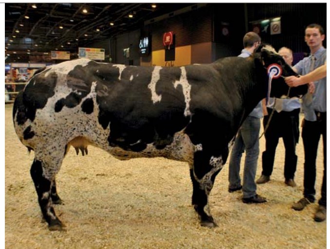
Gueuze (v. Lennie)