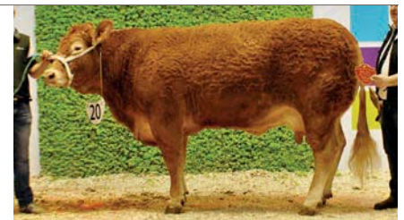
Garniture (v. Accent MN)