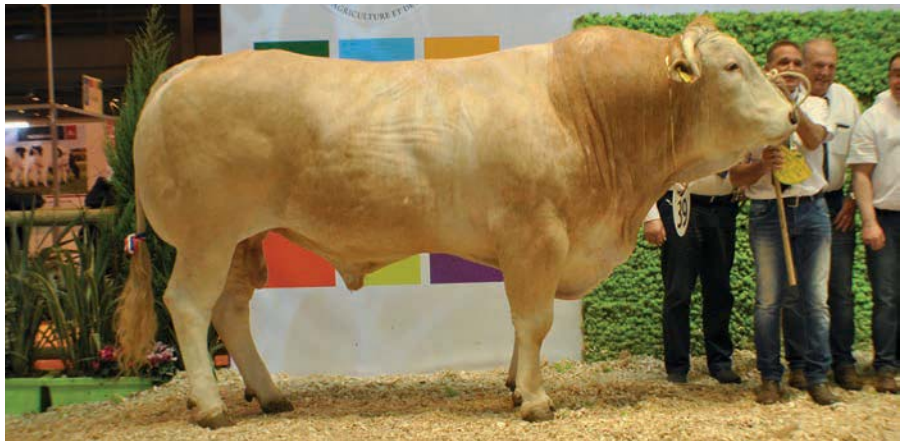
Reus Gagnant (v. Barbes) werd onomstreden kampioen bij de stieren

Arsicaud behaalde met Granada (v. Ushuaia) ook de prijs voor het vrouwelijke dier met de beste slachteigenschappen. Deze titel ging bij de stieren naar de Triofoon Fabuleux van Agri Blondes uit Plessala.