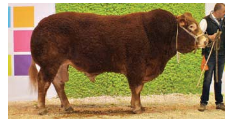
Hippy (v. Elite)