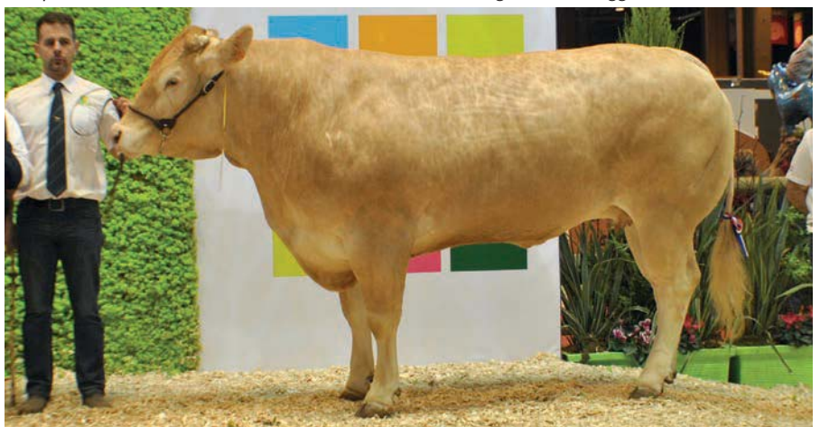
Kampioenskoe Helette (v. Barbes) bekoorde met haar elegantie en langgerekte bouw