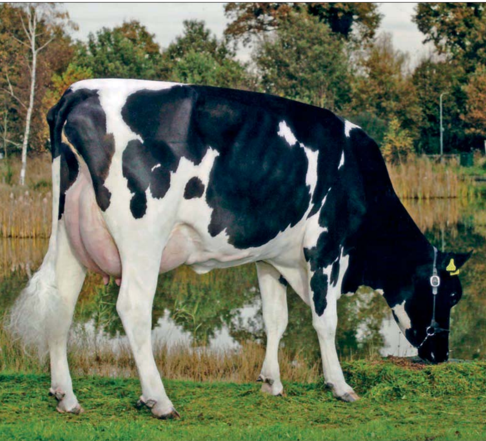
BW Marshall Neblina (v. BW Marshall), 87 punten, 2.01 305 10.854 4,0 3,4

An NU Nyala (v. Numero Uno). Deze laatste werd voor een recordbedrag van 84.000 euro op de Eurogenes Summer Sale geveild en staat aan de basis van DG R Nourya (v. Powerball), hoogste genomgeteste dochter op Italiaanse PFT-basis.