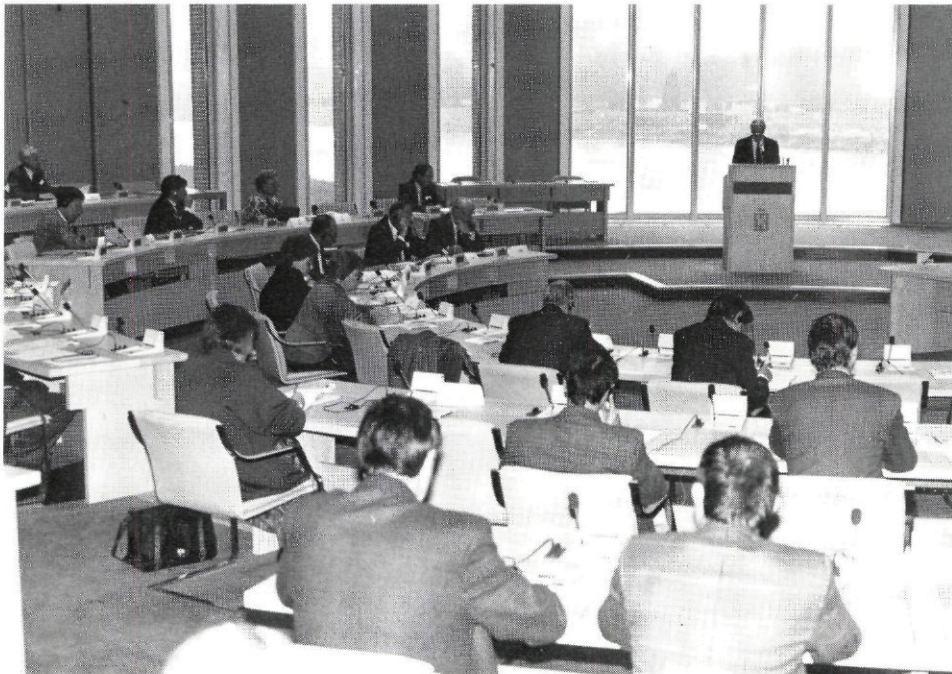
De Statenzaal in het Limburgse Provinciehuis geeft uitzicht op de Maas.

De conferentie spreekt de wens uit, dat de lopende onderhandelingen over de watervedragten op korte termijn en in de geest van de voorgaande uitspraken worden afgesloten.