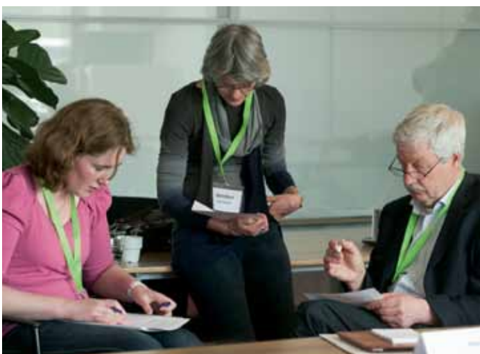
Tijdens de rondetafelgesprekken bespraken professionals de samenwerking tussen humaan en veterinair (zie kader).

“Bij elk overleg bespreken we ook welke ‘afgeronde’ signalen we breder gaan communiceren. Deze signalen verspreiden we onder experts via een maandelijks overzicht. Daarnaast kunnen we zodra dat nodig is gericht communiceren via onder andere de berichtenservice Vetinf@ct voor dierenartsen, ‘Inf@ct’ voor GGD-artsen infectieziekten en Labinf@ct voor artsen-microbiologen. Ook publiceren we geregeld in onder meer het Tijdschrift voor Diergeneeskunde en het infectieziektenbulletin. In het geval van een doormelding van een signaal aan de volgende schakel van de structuur ligt de communicatie bij die schakel.”