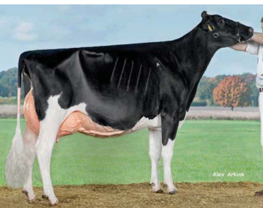
Bons-Holsteins Ella 192 (v. Seaver), algemeen kampioene Prod.: 2.06 392 12.766 4,24 3,83 lw 119