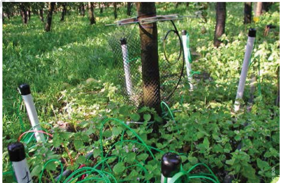
Om inzicht te krijgen in de manier waarop men bodemsensoren het beste opstelt, werd met Watermarkbodemsensoren de waterspanning in de bodem rondom de fruitboom gemeten.

bodemvochtspanning steeds hoger dan -50 kPa in de niet-geïrrigeerde behandeling. De bodem in Bierbeek droogt veel sneller uit dan in Sint-Truiden. Dit was zichtbaar in de proefopbrengst (tabel 1). De droogte leidde in Bierbeek in 2007 tot een productieverlies van 3 kg per boom in de diameterklasse groter dan 60 mm. In de proefplots waar de droogte werd geobserveerd in 2007 werd wel een verhoging van het aantal bloembotten vastgesteld in 2008. Dit kan duiden op een responsmechanisme van de boom. In 2008 werden geen statistisch significante verschillen meer vastgesteld tussen beide behandelingen, hoewel gemiddeld de productie nog steeds lager was in de niet-geïrrigeerde behandeling. In Sint-Truiden werd, in tegenstelling tot in Bierbeek, geen enkel effect van de droogte waargenomen. De productie was in beide behandelingen gelijk. Dit leidt tot