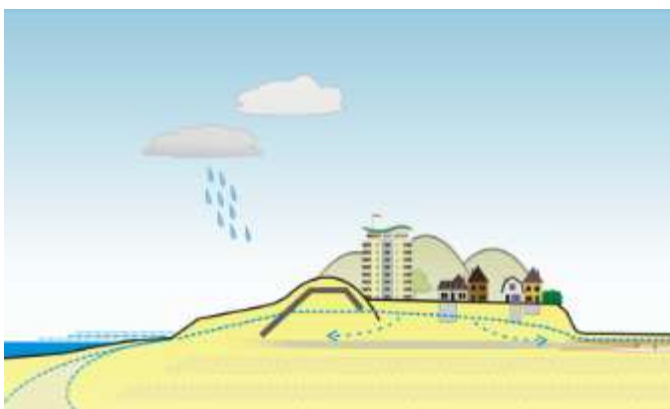
Afbeelding 1: schematische weergave van het grondwatersysteem in Noordwijk aan Zee

Het Hoogheemraadschap van Rijnland en de gemeente Noordwijk sloegen de handen ineen en schakelden gezamenlijk Wareco en Deltares in om dit te onderzoeken. Het onderzoeksdoel was om de oorzaken te achterhalen, te beoordelen of dit een eenmalige of permanente gebeurtenis betrof en welke oplossingsrichtingen mogelijk zijn om toekomstige wateroverlast te voorkomen.