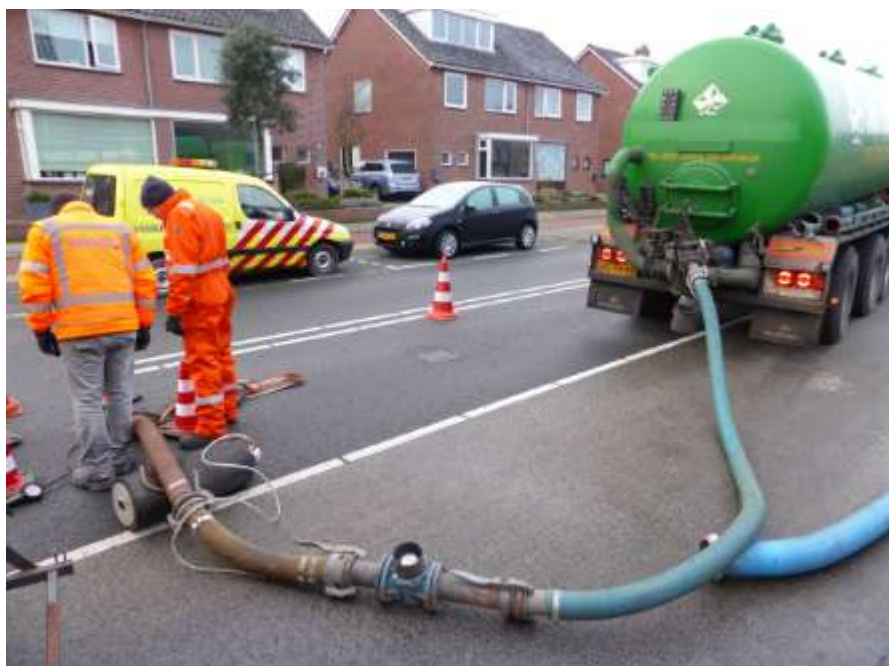
Afbeelding 2: een ledigingsproef in uitvoering bij een infiltratievoorziening

Meer de diepte in: veldproeven en dynamische grondwatermodellering Om te kunnen bepalen tot welke stijging de afzonderlijke invloeden hebben geleid, is vervolgens detailonderzoek uitgevoerd. De nodige gedetailleerde veldgegevens en tijdreeksen zijn verzameld en het grondwatermodel is doorontwikkeld tot een dynamisch model. Wareco heeft diverse veldproeven uitgevoerd, zoals het onder water zetten en bemeten van infiltratievoorzieningen (ledigingsproeven). Ook zijn lekkende rioolstrengen geïsoleerd en onder water gezet, waarna de ledigingstijd is gemeten.