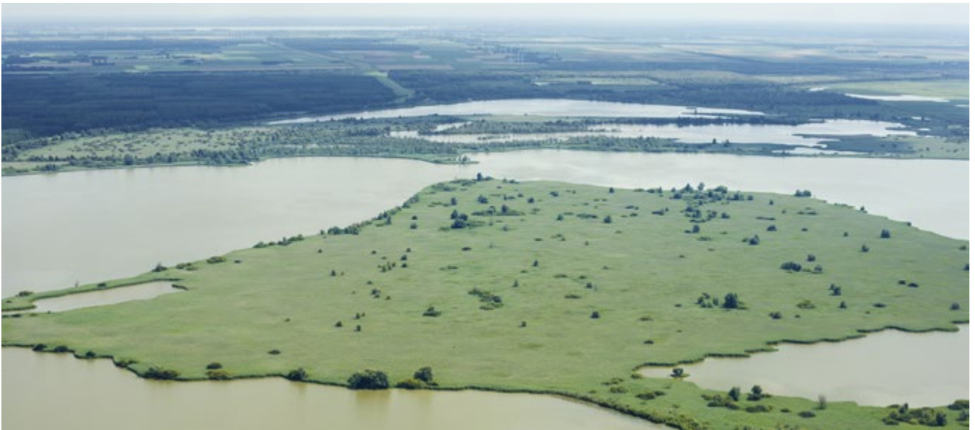
Flevoland heeft de ambitie om van de Oostvaardersplassen het eerste nationale park in de provincie te maken

Hierbij aansluitend wil de provincie ook de adoptie van natuurgebieden door bedrijven en particulieren mogelijk maken. Soortgelijke mogelijkheden voor initiatieven van burgers, maatschappelijke organisaties en bedrijven voor natuur zien we ook in Gelderland, Flevoland, Utrecht, Noord-Holland en Zuid-Holland. In Groningen gaat het vooral om het betrekken van burgers bij de ontwikkeling van beleid. Het college wil de natuurbeleving van de Groningers versterken, bijvoorbeeld door burgers te betrekken bij het inrichten en het beheer van dorpsbossen en door natuurexcursies voor scholieren. In de coalitieakkoorden van Drenthe en Zeeland is geen aandacht voor burgerinitiatieven en natuur. In Fryslân ligt de nadruk op het versterken van krachtige Friese gemeenschappen. Specifiek voor natuur richt de provincie zich op initiatieven vanuit de landbouw en dan vooral gekoppeld aan de zeven gebiedscollectieven voor agrarisch natuurbeheer. In Overijssel richt de aandacht zich vooral op natuurinitiatieven van ondernemers.