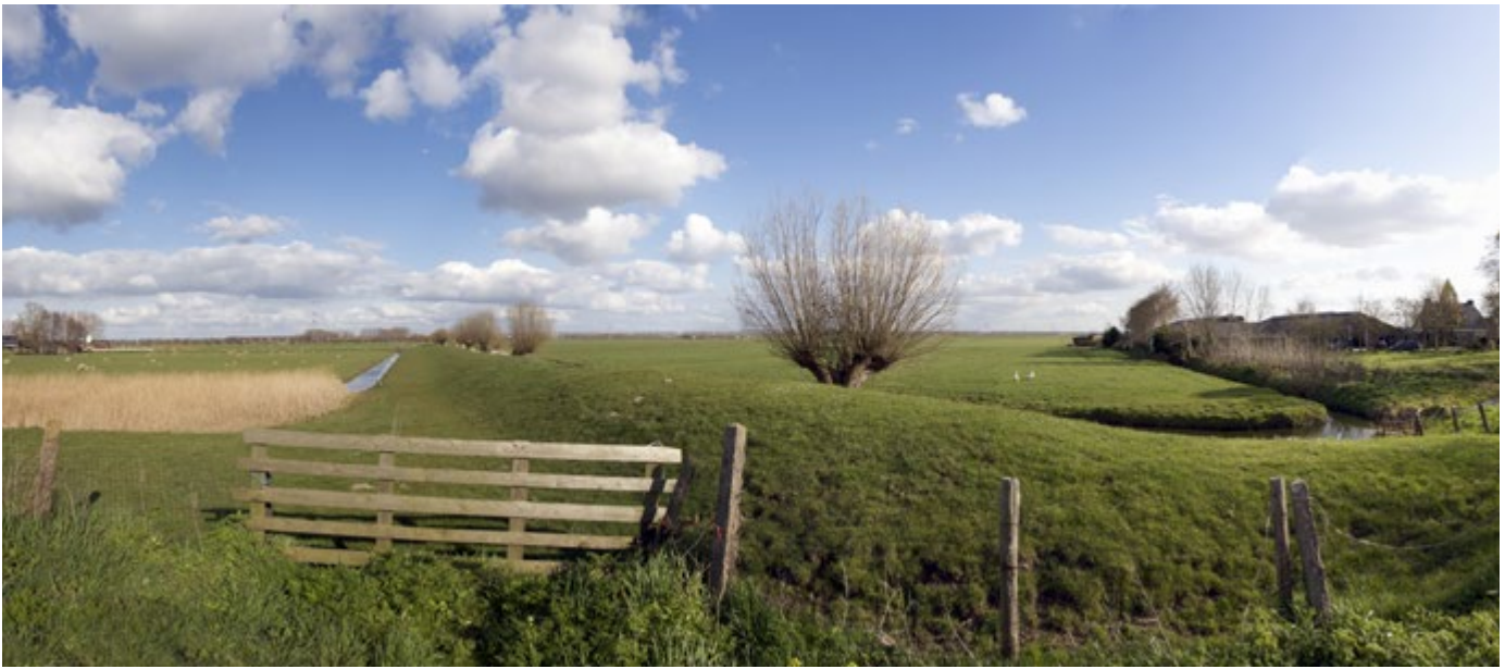
Provincies leggen veel nadruk op de verbinding van natuur met landbouw

de economische ontwikkeling van Drenthe. Daarbij wil het buiten de gemaakte natuurafspraken geen nieuwe natuur meer aankopen. Daarentegen wil Noord-Brabant juist een extra stimulans geven aan de ambitie om het hele oorspronkelijke Natuurnetwerk te realiseren. Het nieuwe college handhaaft deze ambities en wil zelfs het tempo versnellen. Daarbij wil het maximaal meebewegen met de ideeën en plannen van anderen en de eigen wetmatigheden en procedures niet langer centraal stellen.