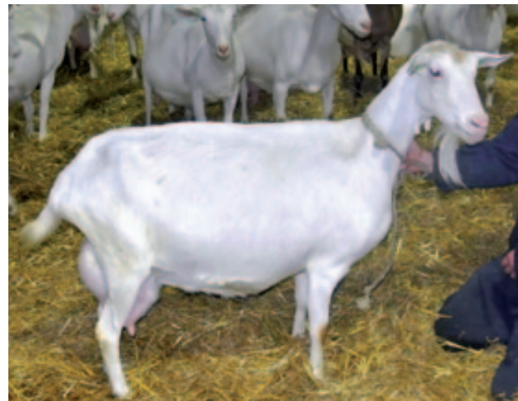
De record-levensproductiegeit bij Meekma: Merilla Aafke T2687. Ze produceerde al 13.877 kilo melk met 4,68% vet en 3,92% eiwit, 1.193 kilo vet en eiwit. Bovendien heeft ze achtmaal afgelamd. Dat telt voor nog wel een paar duizend kilo melk ten opzichte van geiten die maar een paar keer hebben afgelamd, vindt Meekma. "Aafke is maar een licht, smal geitje en dat maakt het extra speciaal. Ze produceert meer dan geiten die wel haast tweemaal zo zwaar zijn."