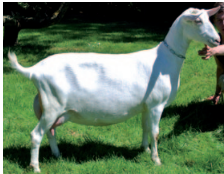
Merilla Maaïke Z42760 (Merilla Ab x Merilla Sido); volgens Klaas Sjoerd de mooiste eenjarige van het bedrijf. Ze heeft zes Merilla-bokken in haar moederlijn, is ingeschreven met 88 punten en voorspeld op 1.400 kilo melk met 4,85% vet en 3,83% eiwit. "Deze geit valt als bokmoeder voor de ki af omdat haar index niet hoog genoeg is, maar wij zetten wel haar eerste zoon in, omdat de moeder mooi is met een mooi vooruier, omdat ze hoog eiwit heeft en omdat ze uit een familie komt waaruit ook productiekampioenes voortkwamen, zoals Merilla Maaïke Z2033, de nummer-1-indexgeit van 2006, 2007 en 2008, en voormalige nummer 1 ki-bok Merilla Foppe."

de laatste jaren hard toegenomen. Dat is ook geen reden om op te roepen tot een verbetering. "Maar die vooruitgang is vooral geboekt in het milieu, de omgeving van het dier. Het kwam door duurmelken, certificaatwaardige dieren, verbeterd mengvoer, verbeterde stal-