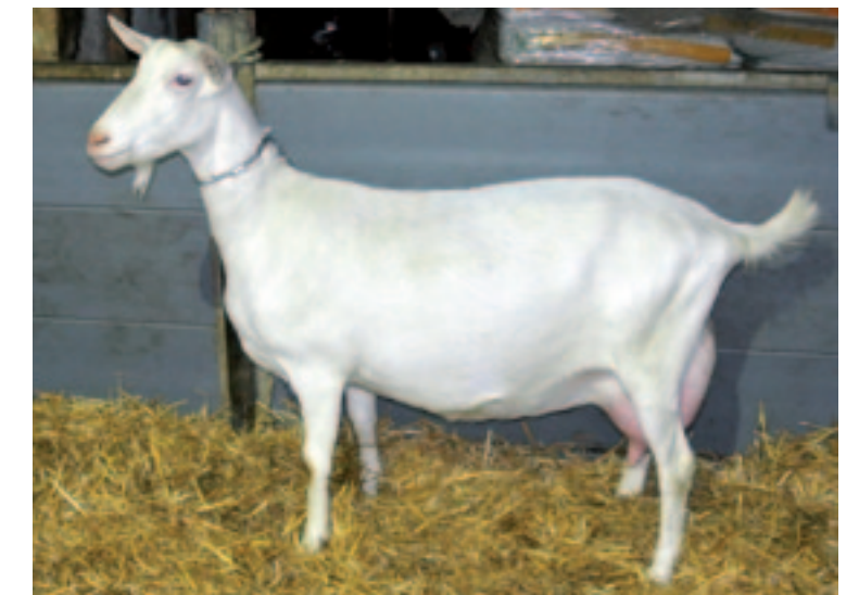
Merilla Ricella 7337 (Merilla Olivier x Merilla Marten 2 x Merilla Joop x Nuub) is op dit moment de hoogste productiegeit in Deinum. Als eenjarige produceerde ze 2.114 kilo melk met 5,01% vet en 3,41% eiwit, LW 187 en nu is ze voorspeld op bijna 2.450 kilo melk met 5,23% vet en 3,63% eiwit, LW 184, nadat ze een vierling bracht. Ricella is in het stamboek ingeschreven met 88 punten en haar eerste dochter werd reservekampioene op de keuring in Wouterswoude. Meekma heeft al twee zonen van haar ingezet. Ricella stamt zoals vrijwel alle geiten in Deinum uit een oude stamboekfamilie; de Ricella's werden gefokt door mevrouw Verdoold uit Polsbroek. "We hebben ook wel niet-stamboekgeiten gehad, maar daar is weinig van overgebleven. Overigens zien we dat de zuivere witte NOG-geiten op ons bedrijf nu niet meer mee kunnen komen qua productie. Daarom kiezen we qua fokkerij onze eigen route", vertelt Meekma.