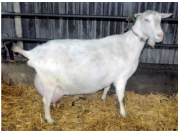
In Deinum heeft kort geleden de 100ste geit de 10.000 kilo melk gepasseerd. "10.000 kilo melk is mooi, maar dat moet een goede melkgeit met duurmilken eigenlijk gemakkelijk kunnen geven", stelt Meekma. "1.000 kilo vet en eiwit is een betere grens om naar te kijken en zegt ook meer over wat de geit heeft opgebracht. We hebben zeventien geiten die dat hebben gepresteerd." Op de foto 10.000-litergeit Merilla Sonja K20927 (Merilla Pieter x Theban Columbus), waarvan Meekma een zoon heeft ingezet.