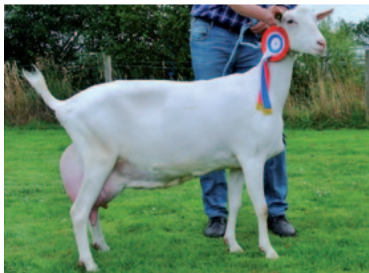
Sinds vorig jaar doen de Meekma's voor het eerst sinds 1999 weer mee aan een keuring. Het afgelopen jaar werd Merilla Minke M7566 (Merilla Olivier x Merilla Marten 2) kampioene van de Witte geiten op de keuring in Friesland. Minke piekte in augustus op 8,8 kilo melk met 5,15% vet en 3,53% eiwit, anderhalf jaar na het aflammeren. Ze is in januari uitgerekend van Merilla Ale en Meekma hoopt op een bokje met scrapie-resistentie; een kans van 1 op 4.

ductie-aanleg binnen die groep, maar dat zegt nog niet dat een nakomeling een goede geit wordt.