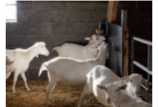
Gras, stro, biks en wat mineralen beslaan het rantsoen van de dieren op dit moment.