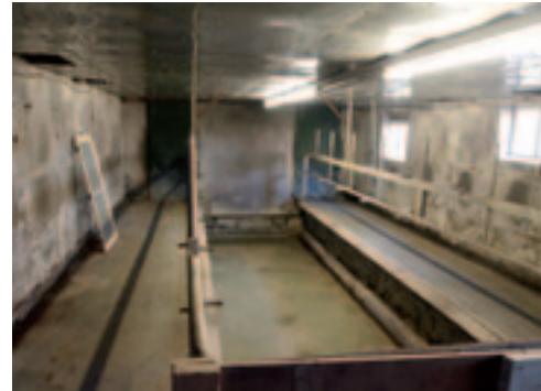
De melkput, waar in februari een werkende melkinstallatie moet staan.