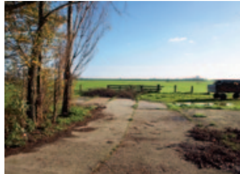
Het uitzicht achter de stal oogt echt Noord-Hollands.