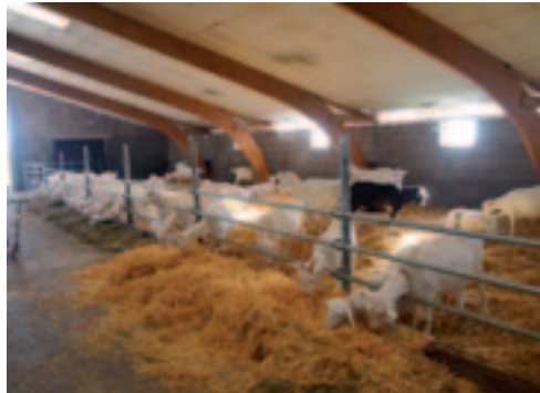
De voormalig koeienstal doet nu dienst als potstal voor de geiten.