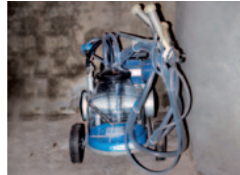
Melken gebeurt nu, mocht het nodig zijn, met een mobiel apparaat.