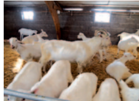
De bok loopt tussen de geiten om voor zoveel mogelijk lammeren te zorgen.