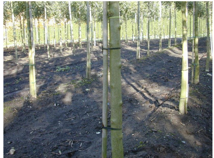
Foto 1. Bindbuis moet goed verwerkbaar zijn in de kwekerij: elastisch en goed te knopen