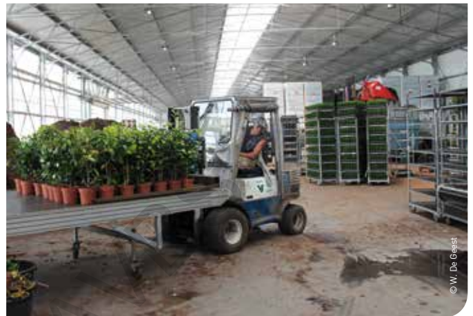
▲ De totale Belgische sierteeltomzet bestaat voor 45% uit sierplanten en voor 55% uit boomkwekerijproducten

De directe kosten zijn globaal gedaald. Zo is de gemiddelde prijs van meststoffen licht gedaald (- 1%), voornamelijk door een terugval van de prijzen van ammoniumnitraat (- 5%) en kaliumchloride (- 6,5%). De prijzen van andere meststoffen (vloeibare stikstof, samengestelde meststoffen) bleven stabiel of kenden zelfs een stijging. Tegelijk daalde ook het gebruik van meststoffen.