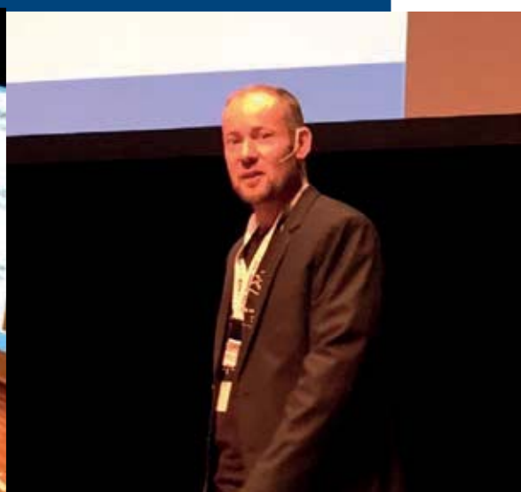
Fish Passage 2015 werd bezocht door 550 deelnemers afkomstig uit veertig verschillende landen.