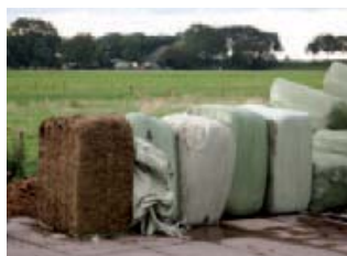
Het ruwvoer voor de geiten bestaat uit grasklaver, vers uit de wei of in balen.