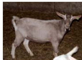
Britse Toggenburger bokken uit België moeten de veestapel verder verbeteren.