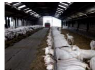
Een simpele blokkenwagen voorziet de geiten tweemaal daags van vers voer.