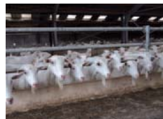
De biologisch gehouden dieren hebben een hoge productie.