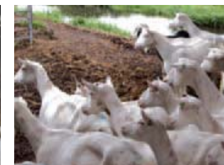
De geiten kunnen, als het minder nat is, elke dag naar buiten.