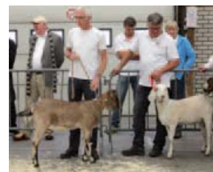
Liberty van de Clabanus en Peatcourt Thea werden 1 e en 3 e bij de Nubische lammeren.