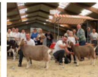
Kampioenen bij de Toggenburgers: Sweelhoeve Elsjie 86 en Sweelhoeve Grietje 45.