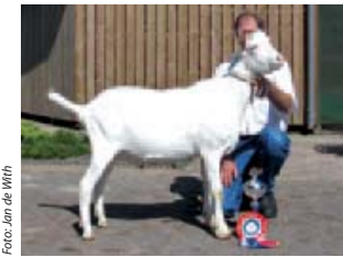
Valentijn 28 van de Tamarahoeve is een zoon van de door Uilke gefokte Valentijn (Boukje 294 x Sanne's Dennis).