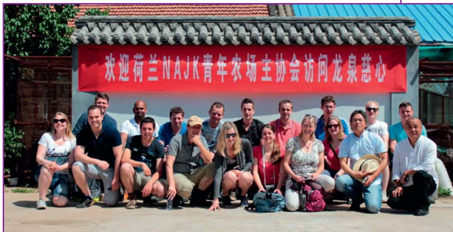
De gehele groep wordt in het Chinees welkom geheten

de tijd is voor recreatie om ook wat van het land en zijn cultuur te leren." Leden van het NAJK konden tegen een kleine eigen bijdrage mee naar China. Deelnemers moesten vooraf enkele vragen invullen om de motivatie en doelen van de deelnemers helder te krijgen. Het programma Wereldboeren duurde drie jaar. Nu dit voorbij is, probeert het NAJK een verlenging te krijgen bij het ministerie van Economische Zaken en het bedrijfsleven.