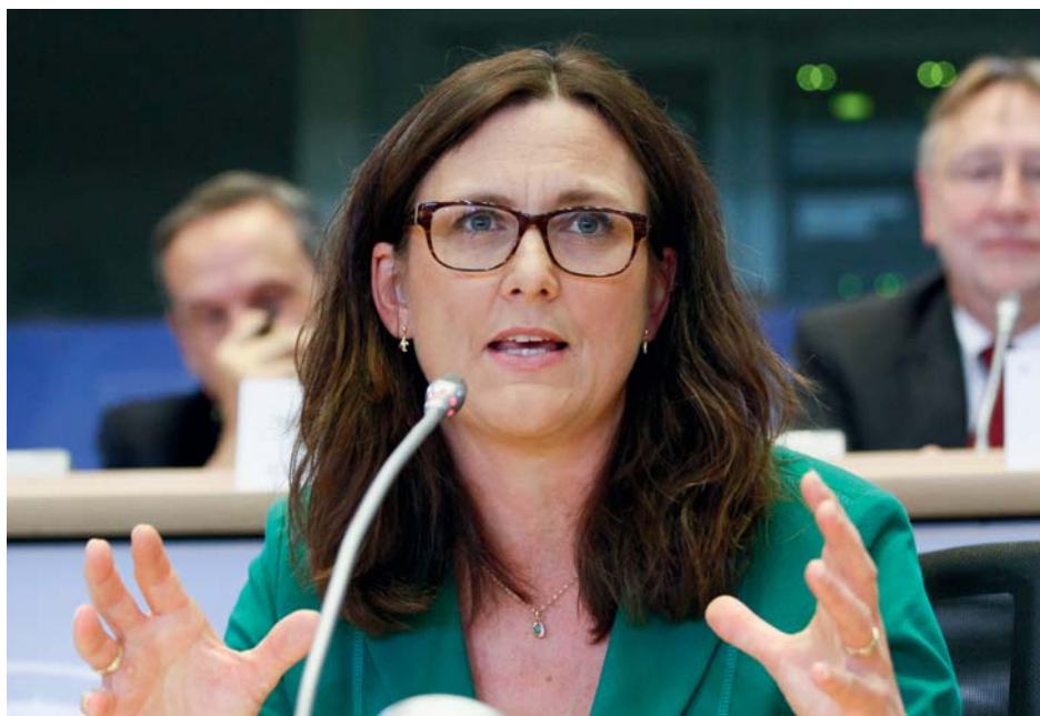
Eurocommissaris Cecilia Malmström van Handel voert de onderhandelingen rond TTIP

Tegenstanders en criticasters vinden de totstandkoming van de overeenkomst ondemocratisch omdat de onderhandelingen plaatsvinden over de hoofden van de onafhankelijke lidstaten. Zelfs Europarlementariërs kunnen amper invloed uitoefenen en dat heeft tot protesten geleid. De lidstaten kunnen pas aan het einde van de rit hun goedkeuring of afkeuring over het totale akkoord kenbaar maken. Verder bestaat bij veel betrokken organisaties de vrees dat de Europese waarden op het gebied van dierenwelzijn, genetische modificatie van gewassen en hormoongebruik onder druk komen te staan door TTIP.