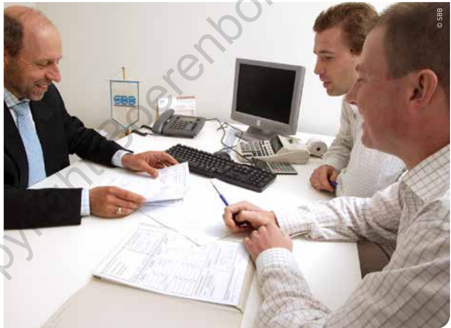
De voorlichting in de landbouwsector is al jaren vertrouwd met financiële en bedrijfseconomische begrippen die berekend worden in bedrijfseconomische boekhoudingen.

tussen het bruto bedrijfsresultaat (BBR) en het totale vermogen. Het BBR wordt hier berekend door de omzet te verminderen met de operationele kosten (handelsgoederen, grondstoffen, diensten) en de loonkosten. Het BBR is vergelijkbaar met het begrip saldo uit de bedrijfseconomische boekhouding. Het is bekend in de sector omdat de minimale bedrijfs-grootte noodzakelijk voor het VLIF berekend wordt aan de hand van het BBR. Het is zeer eenvoudig: hoe hoger dit percentage, hoe winstgevender of rendabeler de onderneming in principe is. Een