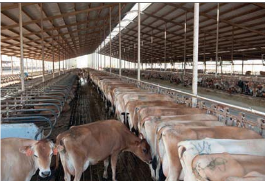
Het melkvee staat onder dak