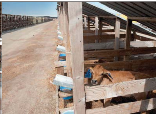
Kalveren blijven acht weken in houten hutten