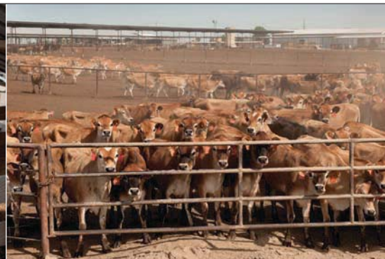
Jongvee en droge koeien lopen in kralen

land te vinden, daarvoor is het te droog. De ligboxenstal is helemaal op maat gemaakt voor de kleine jerseykoeien, net als de 50 stands-buitenmelker van Beco. Voordat de koeien die melkstal instappen, worden hun klauwen automatisch schoongespoten. 'Dat zorgt ervoor dat de koeien schoon de melkstal in komen. Zo houden we de melkstal schoon van mest en van bacteriën.'